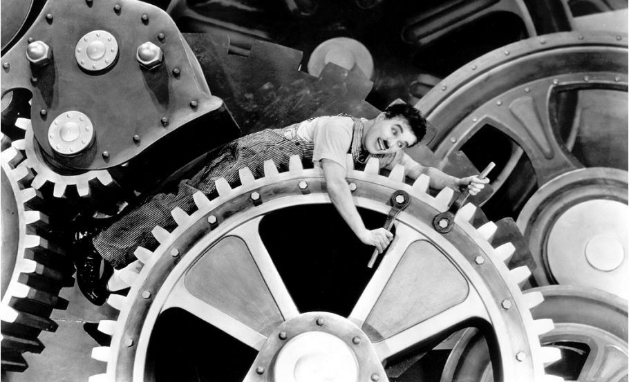
Charlie Chaplin in Modern Times, 1936.

Business as usual and Ovsyankina effect.